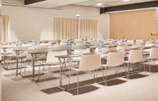
Sala Ceuta 2