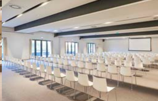
Sala Ceuta 1+2