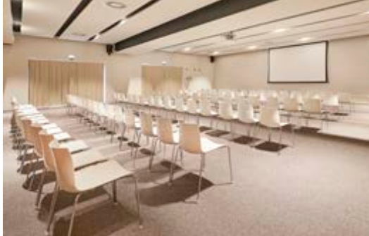
Sala Ceuta 1